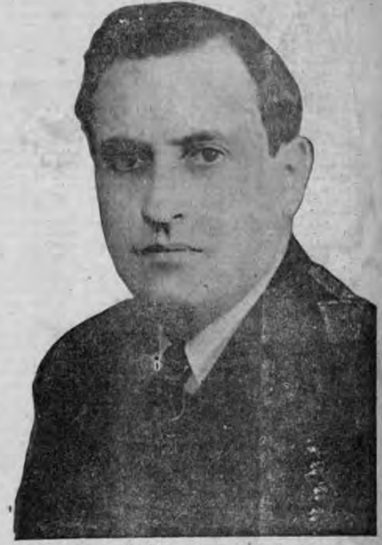
DR. DON RAFAEL ANGEL CALDERON GUARDIA